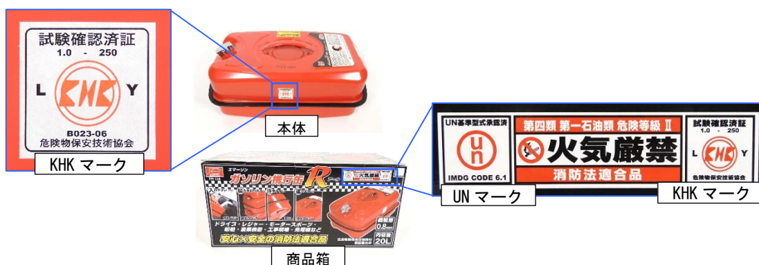
写真2. 消防法令に適合していることを示す表示

(注2) 危険物の国際輸送に関する国際勧告 (UN 規格) に適合した危険物運搬容器に表示される。UN マークの付された容器は、消防法令の試験基準に適合したものとみなされます。