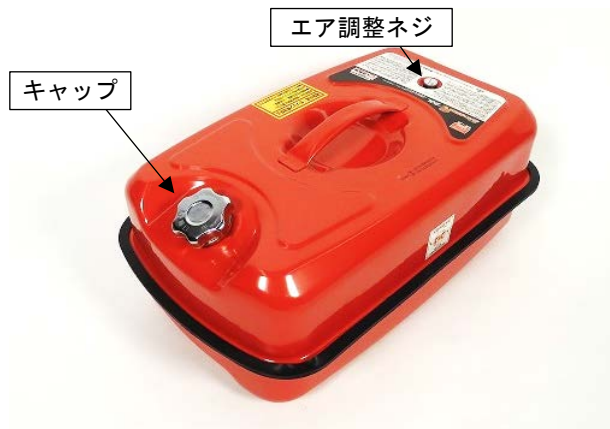
写真1. 当該品の外観(一例)

「エマーソン ガソリン携行缶 R (アール)」(写真1、表1)をお持ちの方は、商品に貼付されたロット番号を直ちに確認してください。対象ロットに該当する場合には、直ちに使用を中止して、販売元であるニューレイトン株式会社(連絡先は4. 参照)にご連絡ください。なお、当該事業者では、同じ仕様のキャップを使用している他の品番についても交換の対応を行なっています。詳細は当該事業者の社告(5 ページに掲載)やホームページでご確認ください。