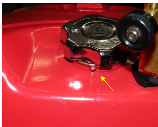
写真3. キャップから水が漏えいする様子 (内圧試験)

(注4) ガソリン携行缶の内部に水圧力 100kPa を加え、5 分間保持したときに漏えいがないことを確認する試験。